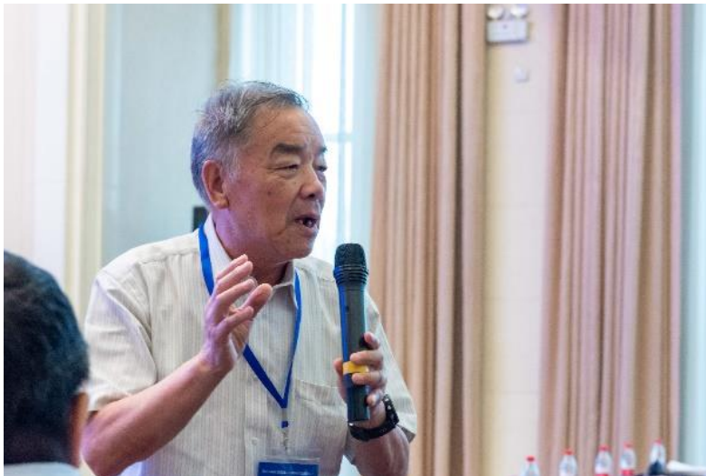
中国科学院数学与系统科学研究院石钟慈院士致辞