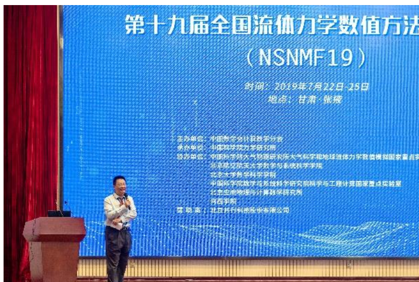
中国科学院力学研究所李新亮研究员主持开幕式