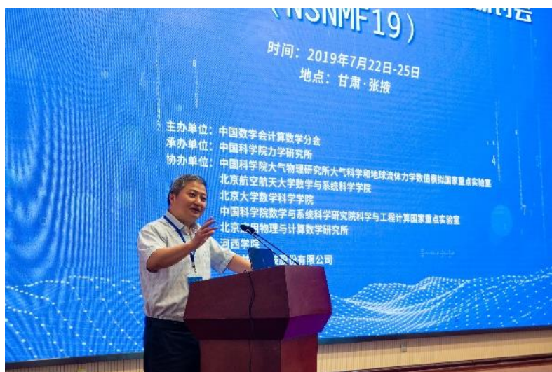
国家自然科学基金委员会数理学部主任江松院士致辞