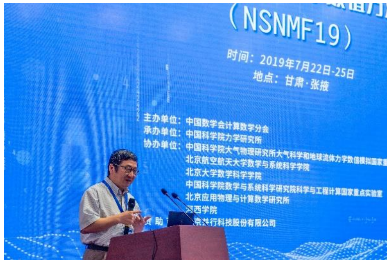
大会主席、中国科学院力学研究所何国威院士致辞